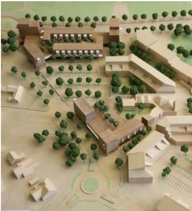
Das Modell macht deutlich: Das Zentrum wird größer, attraktiver und kundenfreundlicher.